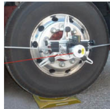
Mérőfej alu-tárcsa rögzítővel