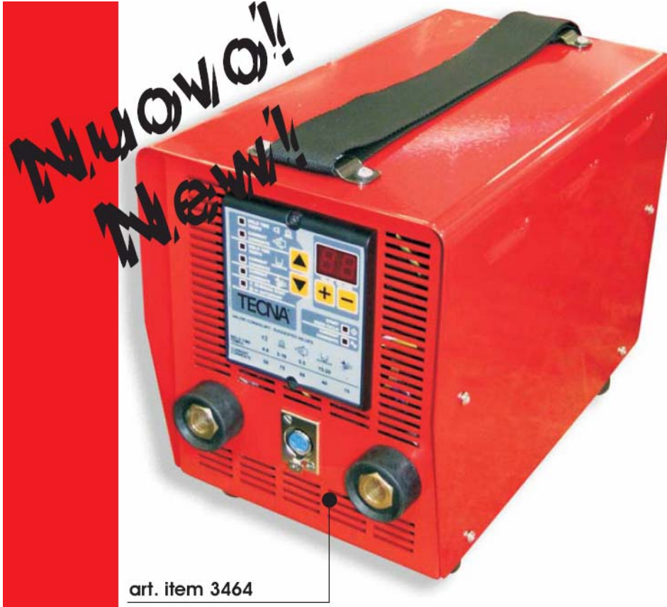
art. item 3464

Nagyon sokoldalú az ideális berendezés a gépjármű karosszéria javító műhelyek számára