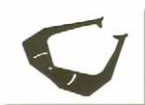
Gauge (cod. 300104)