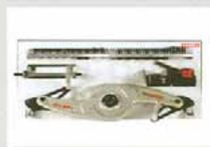
Motorcycle flange (cod. 300106)