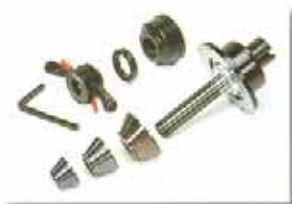
Flange complete with cones (cod.300103)