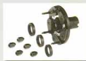
3-4-5 hole flange (cod. 300116)