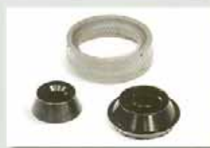
4rd - 5th cone spacer (cod.300146) (cod. 300107) (cod. 300117)