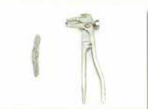
100g sample weight - pliers (cod.100218) (cod. 100152)